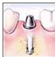
◀ Schließlich wird die Heilkappe entfernt und ein Metallpfeiler oder Aufbauteil auf der Verankerung befestigt.

Wenn das Zahnfleisch und der Kieferknochen verheilt sind, wird eine Krone (künstlicher Zahn) gefertigt und auf den Pfeiler aufgeschraubt oder aufzementiert. Zur Anpassung der neuen Krone sind möglicherweise mehrere Zahnarzttermine erforderlich.