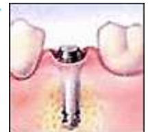
Dann wird eine "Heilkappe" plaziert, wenn das Implantat freigelegt wird. ▶